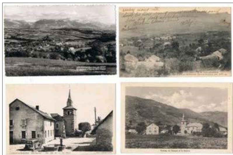
Fig. 3. Carte postale du chef-lieu de Vovray-en-Bornes au début du XX e siècle. Le centre du village, peu urbanisé, est composé de fermes éparses, de grands terrains, du cimetière autour de l'église (jusqu'en 1914).

Les « Dons de mémoires » font partie d'un processus de protection du patrimoine dans sa globalité, initié par La Salévienne. En récoltant la mémoire des anciens, un certain nombre de pistes se dégagent et seront exploitées. En enregistrant les témoignages, la connaissance est sauvegardée. Cela permettra de nous aider à établir des inventaires du patrimoine matériel visible, et de les ancrer dans leur histoire authentique grâce aux connaissances issues des té-