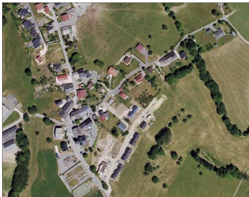
Fig. 4. Photographie aérienne du chef-lieu de Vovray-en-Bornes en 2015. Des destructions et des aménagements sont survenus au XX e siècle, notamment Chemin de Vardon. Des nouvelles maisons ainsi que de nombreux collectifs ont été implantés au début du XXI e siècle : le « Hameau du Salève » aux toits gris et le « Pré de la Gusta », en construction, dont la route d'accès rogne dans les terres agricoles.

Tous les documents fournis sont scannés, sauvegardés de la même manière, et rendus à leur propriétaire. Nous essayons autant que possible de noter les noms donnés et les informations acquises.