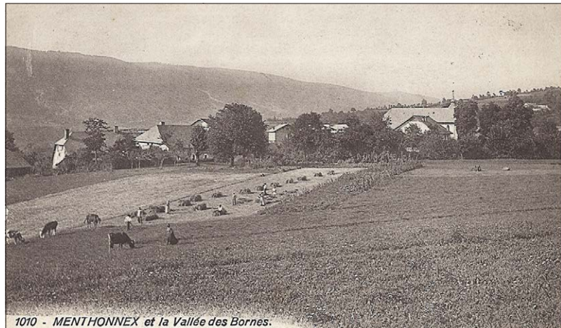
Fig. 1. Illustration du Salève en arrière-plan, du patrimoine bâti au second plan avec ses fermes, du patrimoine immatériel au premier plan avec les travaux des champs. Carte postale du fonds de La Salévienne.

Ainsi, dans le cadre d'un stage de Master Histoire-Patrimoine effectué en 2015 en partenariat entre