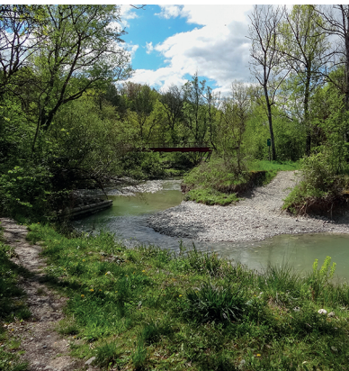
La Laire trace la frontière franco-suisse.

Restaurant Café d'Avusy (Chez Casa) à Avusy, 022 756 26 70, www.restaurant-cafe-avusy-chez-casa.ch/fr/