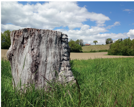
Bosquets et champs cultivés s'alternent.