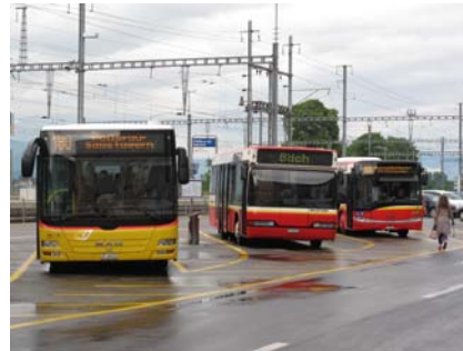
III. 26–27. Transbordement sous la pluie (à gauche la gare de Thoune, à droite la gare de Pfäffikon SZ).