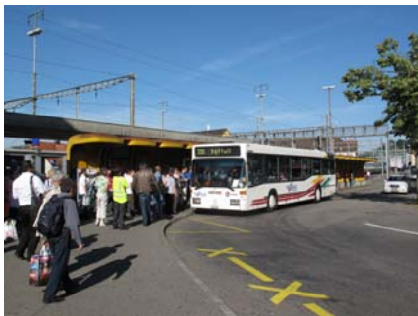
III. 28. Manque de place : aux heures de pointe les passagers-ères se bousculent sur les quais des arrêts bien trop étroits (Lenzbourg).