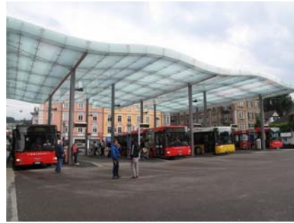
III. 16–17. De nouvelles gares routières (à gauche Dornach SO, Bâle-sud ; à droite Wädenswil ZH).