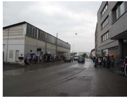
III. 24–25. L'arrêt du RER Bâle-Dreisitz a été distingué en 2008 par le Brunel Award pour une architecture d'installations ferroviaires gare facture (à gauche). À droite l'arrêt de bus à proximité immédiate