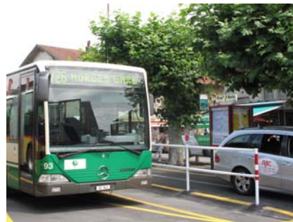
III. 29. Manque de place : à Morges il faut se déplacer sur la voie réservée aux taxis pour pouvoir déchiffrer les horaires placés derrière la voiture).