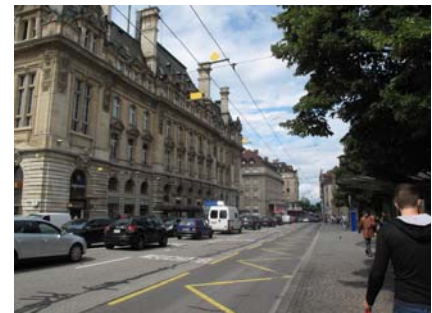
III. 30–31. Deux pôles de transbordement aux rythmes bien différents : à gauche la calme gare d'Yverdon-les-Bains, à droite la trépidante place St. François à Lausanne.