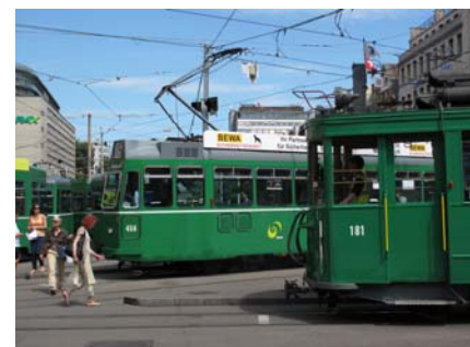
III. 22. Toutes les informations sont disponibles devant la gare CFF à Bâle.