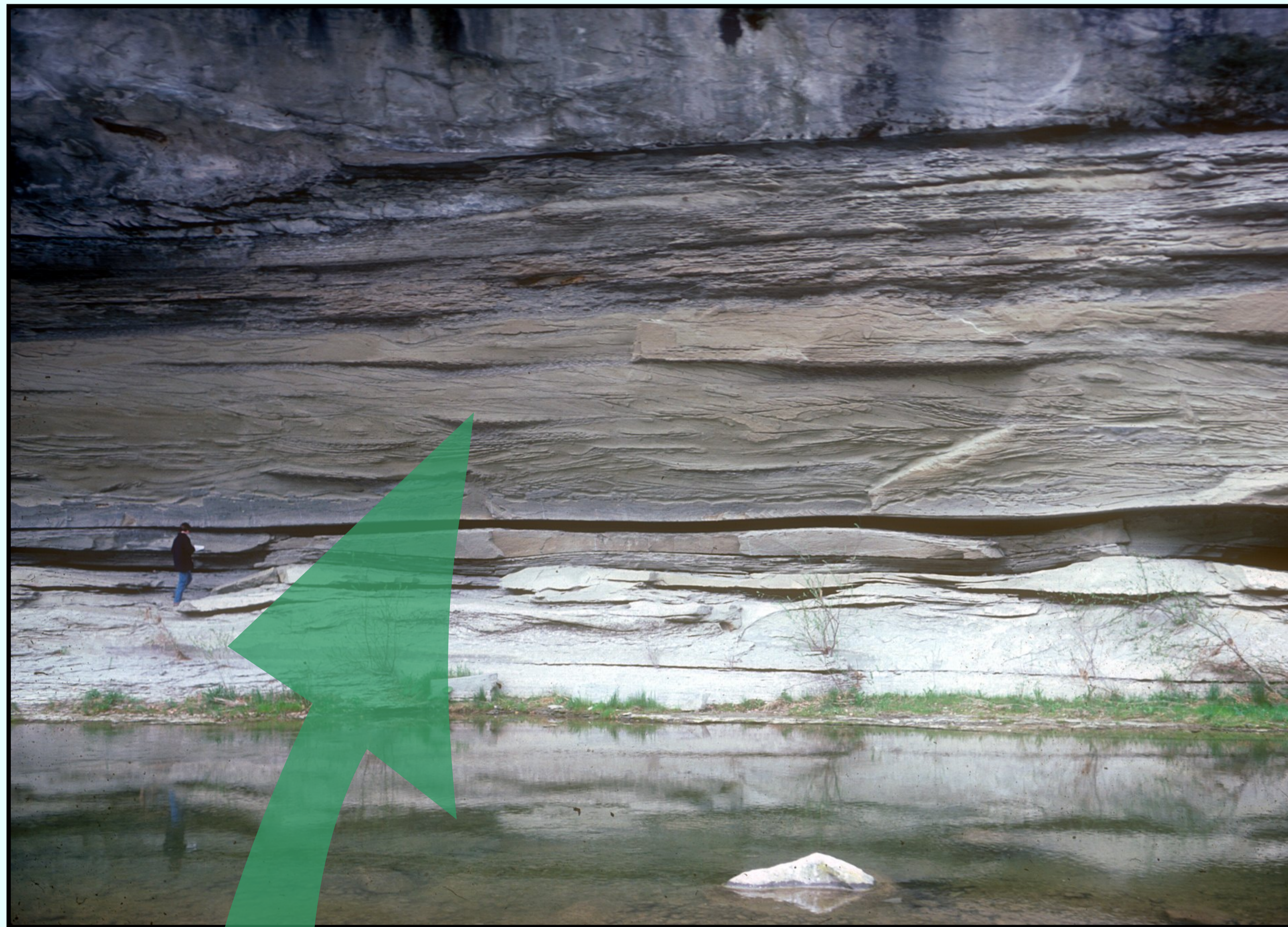
Dépôt de marée dans la Molasse marine contenant des dents de requins