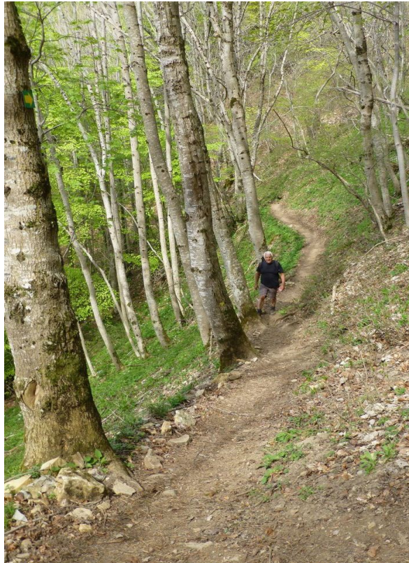
Le sentier serpente en sous-bois

Nous partons en direction du nord-est en traversant le hameau du Coin en utilisant divers raccourcis que Cécile (qui habite dans le quartier) connaît bien. Il faut environ 30 minutes pour arriver au bas de la Grande Gorge (altitude 600m). Un panneau indique généreusement 2h05 pour la montée.