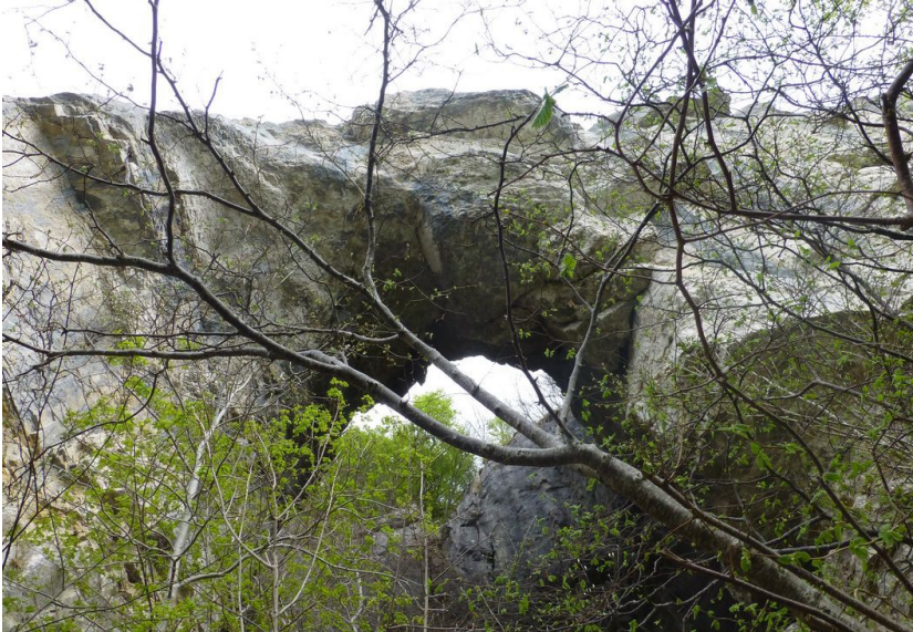
Le trou de la Tine

faut prendre son temps pour admirer la vue et aussi pour regarder où nous mettons les pieds... Comme certaines parties du chemin passent au-dessous de surplombs, les aménageurs du Salève en ont profité pour en faire un sentier géologique avec des panneaux d'explications auxquels personnellement je ne comprends à peu près rien, je me demande toujours s'ils ne s'agit pas de panneaux faits par des géologues... pour des géologues ! Nous croisons quelques marcheurs avec lesquels il convient de rester très poli, ce n'est pas vraiment le lieu pour une bousculade !