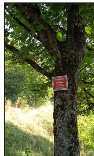
Ce projet est un travail partenarial avec la commune et l'ensemble des acteurs de la chasse.

Acteurs du territoire, l'association communale de chasse a tenu à veiller à la conciliation de cette volonté communale avec la pratique cynégétique et son cadre réglementaire.