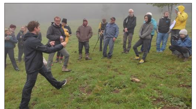
De riches échanges qui vont conduire les uns et les autres à ajuster leurs pratiques.

Mardi 21 septembre, les alpagistes de La Thuile et de Chênex ont accueilli les élus et membres du Syndicat mixte du Salève pour échanger sur leurs observations faites cette année sur la conduite des animaux au pâturage et la relation avec la végétation.