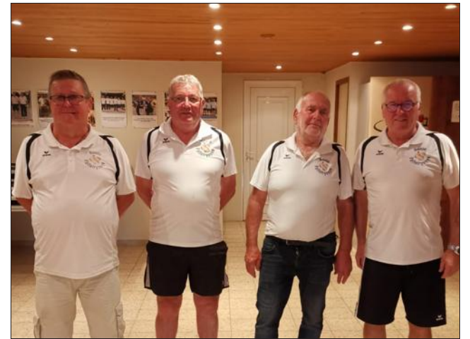
Les champions de Haute-Savoie vétérans.