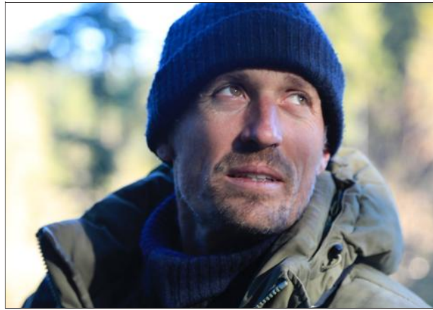
Parmi les films proposés, "Vincent Mugnier, éternel émerveillé", documentaire sur un photographe animalier mondialement reconnu.

Plus d'informations sur le site : www.festivaldufilmvert.ch