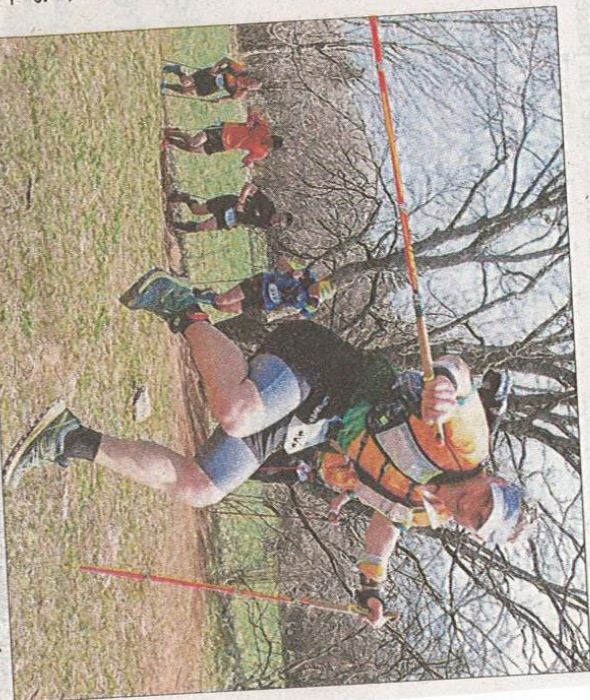
Malgré les mesures sanitaires, la course gardera son côté convivial qui la définit depuis dix années.