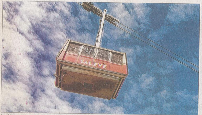
La direction organise de nouvelles offres pour attirer une clientèle plus locale.

Le site va par ailleurs lancer dans les prochains jours une campagne d'automne en capitalisant sur une nouvelle pratique du téléphérique depuis la fin du confinement : les allers simples.