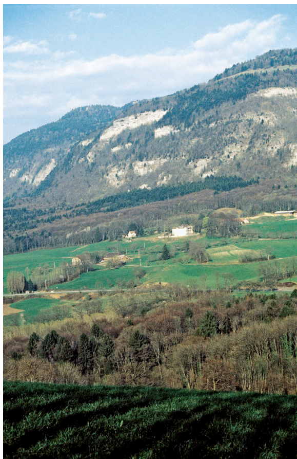
Figure 1 – La chartreuse de Pomier, au pied du Salève. La façade blanche est celle de l'ancienne « maison haute », résidence du prieur et des pères ; au-dessous, l'ancienne maison basse, ou « corrière » (lieu-dit La Quory), où logeaient et s'activaient les frères convers ou laïcs. Couronnant des falaises, les pâturages de La Thuile et des Convers, où les vestiges de sidérurgie directe sont importants.