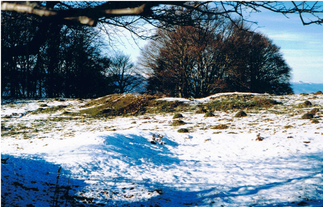
Figure 2 – Quatre amas de scories légères, en élévation, bien visibles sur le pâturage de la Béroudaz, au-dessus du chalet des Convers.

archéologique 6 . Deux types de scories, technologiquement différents, furent alors distingués, correspondant à deux formes spécifiques d'amas – certains crassiers étant en effet nettement plus effacés, plus érodés que les autres. Une relation topographique fut établie entre les amas les mieux conservés, encore en élévation ( fig. 2 ), composés de scories légères, pauvres en fer, et les granges ou vestiges de granges, les abreuvoirs, les cheminements, bref les traces de la mise en valeur pastorale du massif. Or, cette « rationalisation » de l'exploitation des forêts et des pâturages du Salève peut être attribuée aux chartreux, qui s'installèrent quelques années avant 1170 sur le territoire de la paroisse de Présilly 7 . Ces relations étroites entre traces agricoles et déchets de réduction supposaient une implication des moines dans la valorisation « industrielle » de leur domaine.