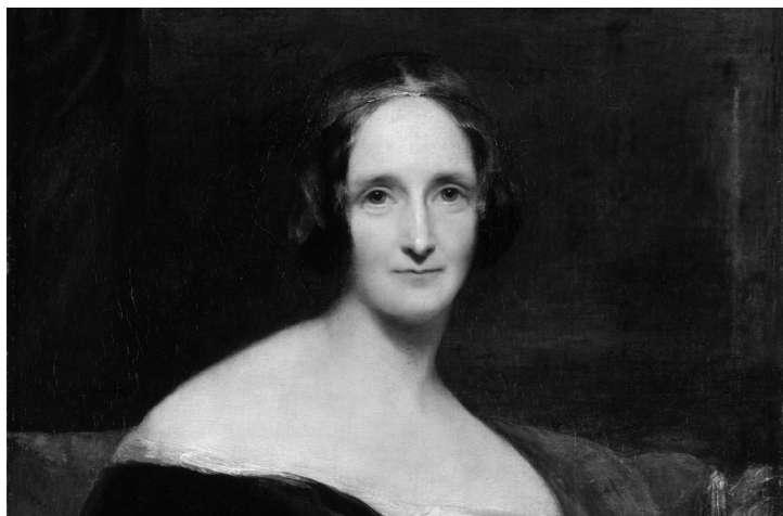
Richard Rothwell, « Mary Wollstonecraft Shelley » (Huile sur toile, 1840).