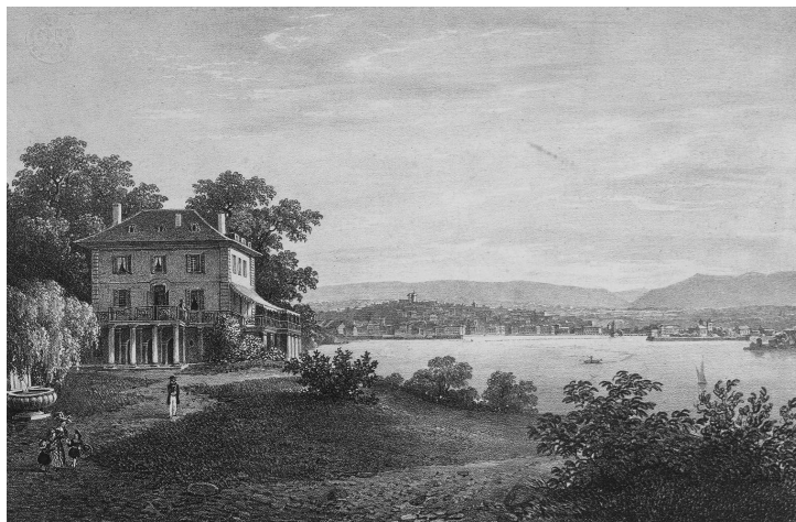
Cologny, vue de Genève prise de la maison Diodati (Lithographie, 1 ère moitié du 19 e siècle).

Après un long prologue, le personnage principal et narrateur entame le récit de son aventure par ces mots qui forment donc la première phrase du premier chapitre du roman : « Je suis originaire de Genève et ma famille est l'une des plus distinguées de cette république. »