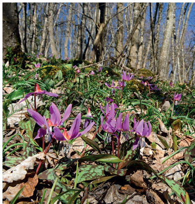
Vivante et colorée, la forêt à l'état naturel est un emplacement de choix pour ces fleurs délicates.