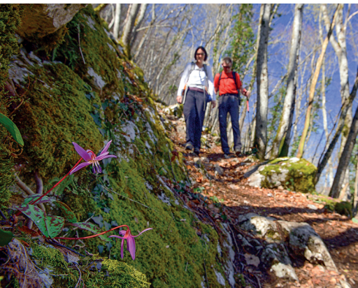
Les arbres sont encore dénudés et laissent passer la lumière sur les dents-de-chien.

Le Pays du Vuache, www.pays-du-vuache.fr