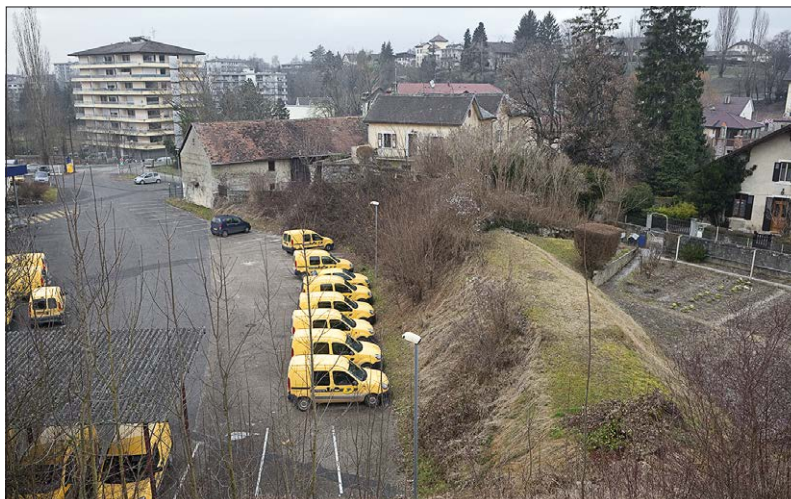
Fig. 7. L'ancien moulin de Saint-Julien, 2008. On distingue, au premier plan, la trace du bassin d'accumulation, et, à l'arrière-plan, le moulin transformé vers 1880 en minoterie.

son importance passée. Edifiés pour leur part au XVIII e siècle, les deux établissements suivants – les moulins Rambosson et Pernoux, dont les bâtiments, ainsi qu'un battoir, subsistent – présentaient des caractéristiques moins favorables, ce qui laisse penser qu'ils avaient interrompu leur activité avant la fin du XIX e siècle. Le moulin le plus spectaculaire se trouve toutefois au sud de Saint-Julien. Tirant partie d'une double alimentation (son bassin récoltait aussi bien les eaux du ruisseau de Ternier que de celui de la Folle) et d'une importante hauteur de chute, il présentait un potentiel sans commune mesure avec les autres établissements de la région. C'est ainsi qu'en 1809 ses trois roues actionnaient, chacune, non pas une meule tournante mais deux, à l'exemple des puissantes installations édifiées sur le Rhône. L'exploitation fut transformée en minoterie autour de 1880 (minoterie Duvernay) avant d'être équipée