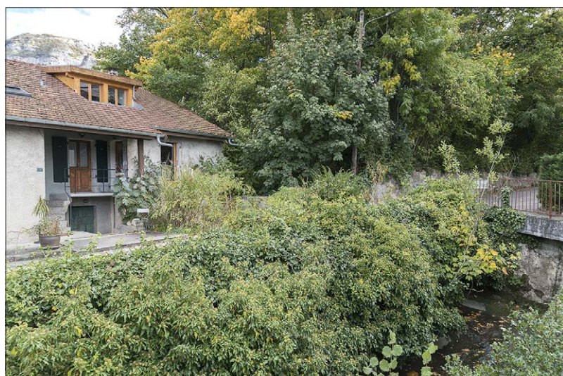
Fig. 4. L'ancien moulin du Collonges, 2017 (OPS). En amont du bâtiment, on discerne le bassin d'accumulation désaffecté. Au premier plan coule la Drize.

la fois par une dérivation de la Drize et par la seconde moitié des eaux de la source du Coin. Il passait pour bénéficier de meilleures conditions d'exploitations que celui du bas, lequel dépendait, sauf lors des fortes pluies, de l'eau stockée dans le bassin du premier pour faire tourner ses meules. De façon assez étonnante, en dépit de la pression exercée par l'urbanisation de Collonges-dessous, la construction de l'autoroute et le déplacement partiel du lit de la Drize, les deux anciens bâtiments hydrauliques subsistent toujours, ainsi que le réservoir oblong en maçonnerie du second (Fig. 4).