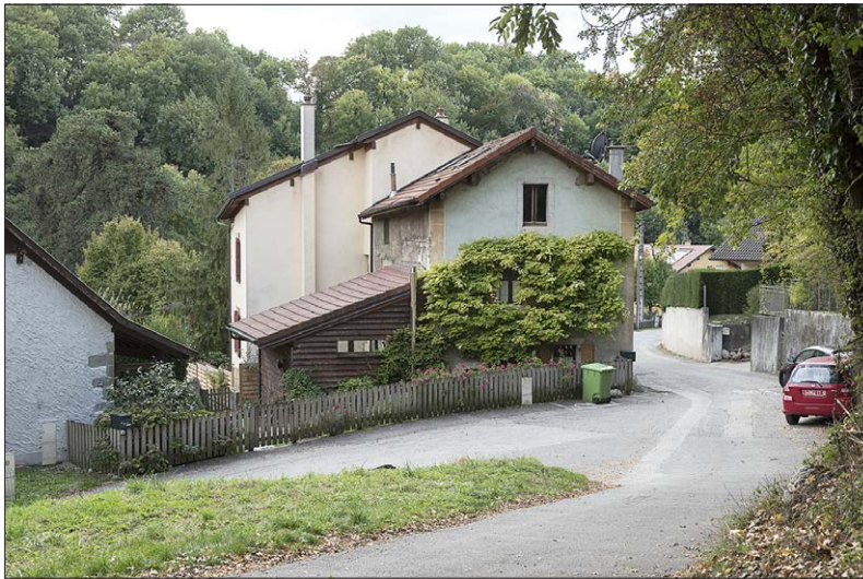
Fig. 5. L'ancien moulin de Ternier, 2017 (OPS). Les roues de l'établissement étaient installées à la hauteur de l'appentis en bois. Elles étaient actionnées par l'eau contenue dans un bassin qui se développait au premier plan.