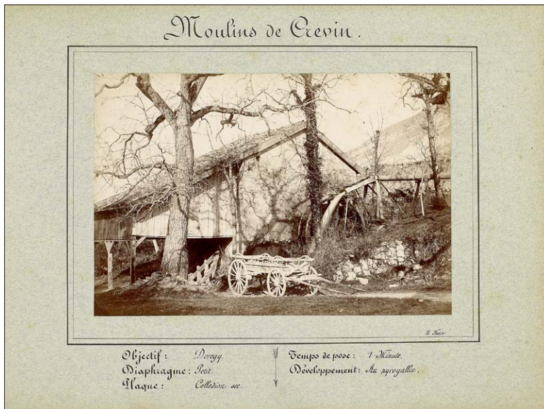
Fig. 3. Le premier des trois moulins de Crevin, vers 1880 (BGE-CIG). Le site comprenait trois bâtiments, tous démolis. Seul subsiste aujourd'hui son imposant battoir, entreposé en contre-bas de la route de la Croix.

bières, une mesure qui pourrait l'avoir préservé de la concurrence directe des importants moulins de Sierne (Arve). Signe du dynamisme de son exploitant et de conditions hydrologiques meilleures que son implantation dans une zone alluviale ne pourrait le laisser supposer, les trois roues historiques furent remplacées vers 1850 par une roue unique en métal de plus grande puissance. Ayant tourné jusqu'en 1920, le moulin de Veyrier (également appelé moulin Bosson) est l'un des établissements meuniers à avoir maintenu son activité le plus tardivement. Le site demeure dans un bon état de préservation extérieure, seule la roue ayant été supprimée.