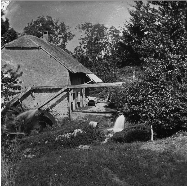
Fig. 2. Le moulin d'Etrembières vers 1870. Le site comprenait trois bâtiments dont seul subsiste aujourd'hui le principal, malheureusement délesté de ses deux roues spectaculaires.

zaine de moulins répartis à intervalle plus ou moins régulier le long du pied de son versant occidental. Sur le plan hydrologique, deux réseaux se dessinaient. Le premier, de régime nivo-pluvial, comprenait les cinq établissements alimentés par des sources du Petit Salève et par le cours supérieur de la Drize, qui bénéficiaient de conditions d'exploitation plutôt favorables la majeure partie de l'année. Le second réseau, situé à la jointure entre le Salève et le Mont-Sion, comprenait une dizaine établissements alimentés par deux cours d'eau de régime essentiellement pluvial, les ruisseaux de Ternier et de La Folle. Du fait de la durée de l'étiage de ces derniers, ceux-ci ne tournaient qu'entre six et huit mois, lors des pluies de printemps et d'automne principalement. Dans tous les cas, le recours à un bassin d'accumulation était requis.