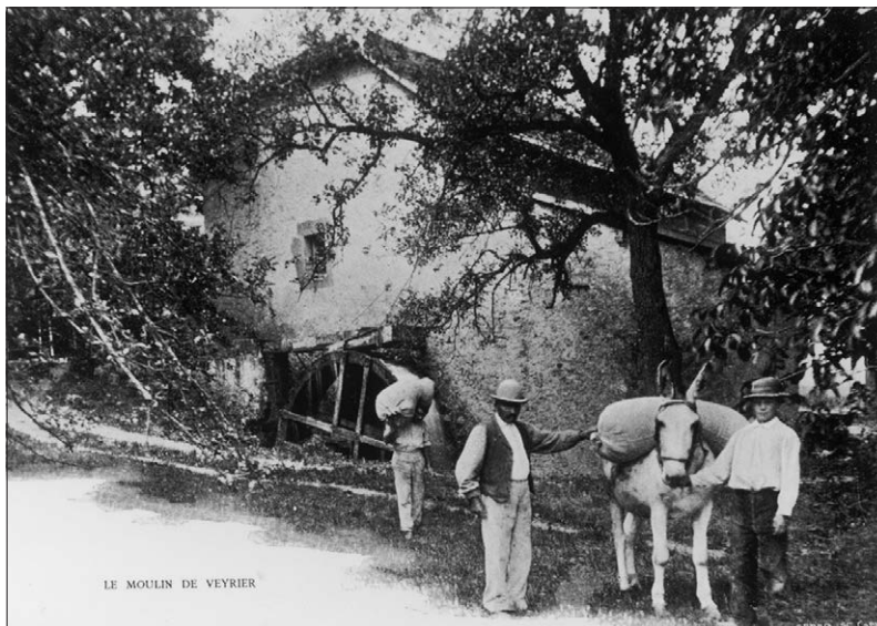
Fig. 1. Le moulin de Veyrier (commune d'Etrembières) vers 1870. Un moulin ne se réduit pas à un simple bâtiment abritant un dispositif mécanique. Il comprend également une source d'alimentation, un moteur et un canal de fuite. L'ensemble forme un paysage singulier.

Le XVIII e et la première moitié du XIX e siècle passent pour être le second âge d'or des moulins. L'affaiblissement, puis la disparition des droits seigneuriaux facilitèrent la création d'une nouvelle génération d'établissements, dotés des dernières innovations : roues métalliques à augets, transmissions par poulies et courroies, meules en silex assurant une mouture plus fine (« mouture économique ») que celles en grès du Faucigny, blutoirs séparant le son de la farine, etc.