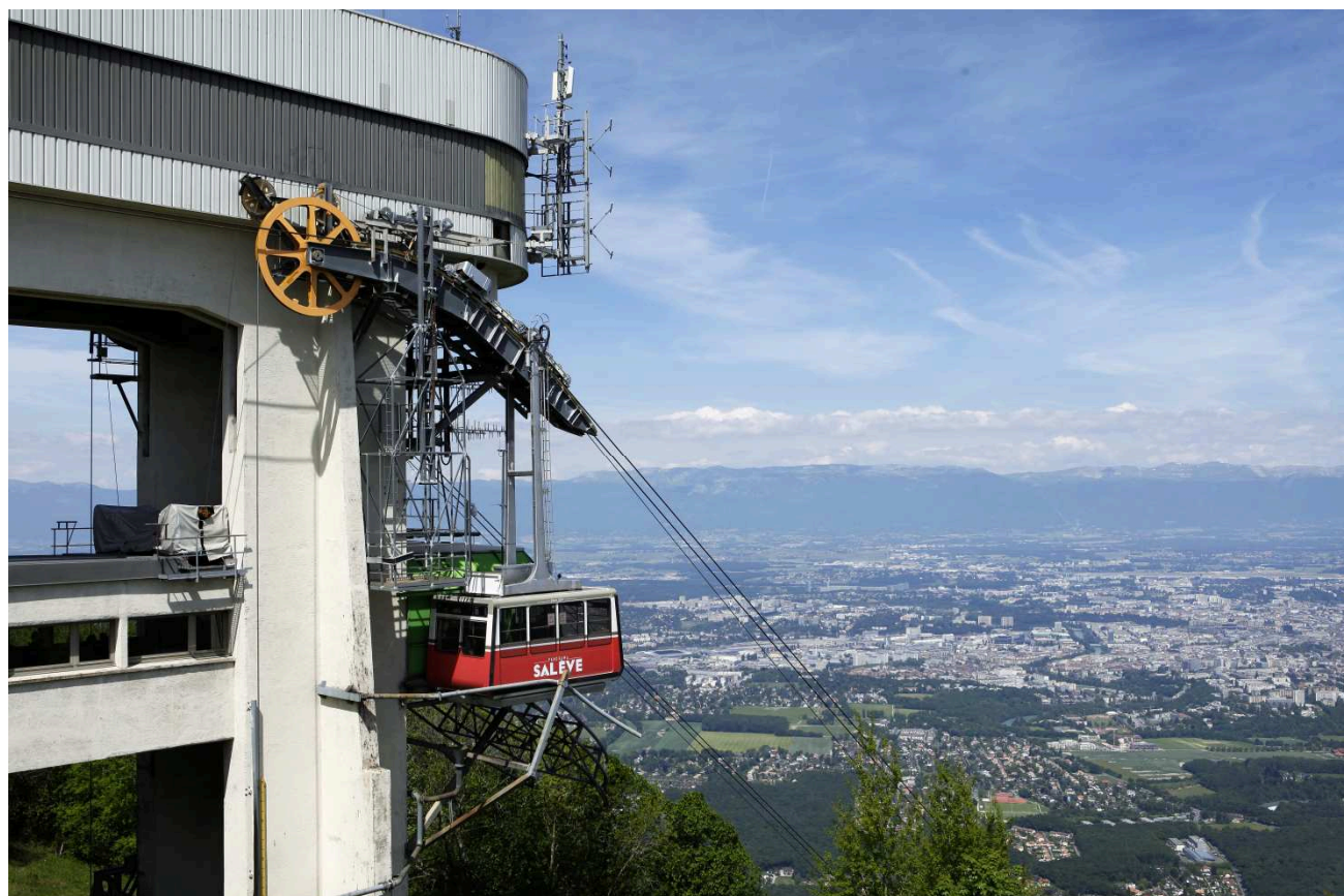
Gare supérieure du Téléphérique du Salève