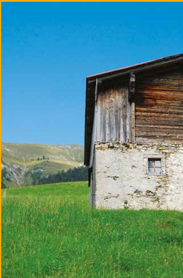
Grange en dessus de Château-d'Ex