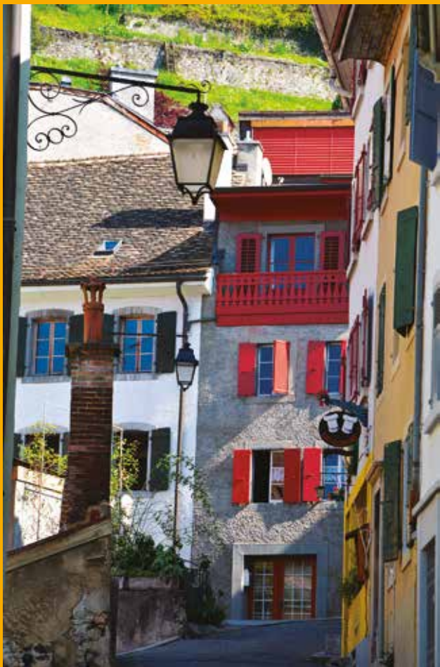
Ruelles du quartier des Planches de Montreux