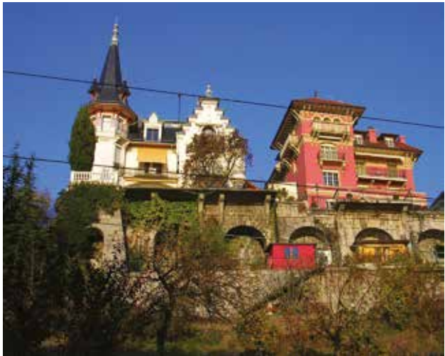
Maisons aux styles bigarrés de la Riviera

Le tourisme dans cette région bénie des Dieux a pris son essor dans le courant du 19 e siècle, suite à la mise en valeur des lieux par des écrivains comme Rousseau ou Byron. Les palaces ont pu alors se construire, à une époque où de riches familles aristocrates d'Angleterre, de Russie, etc., louaient les suites... à l'année !