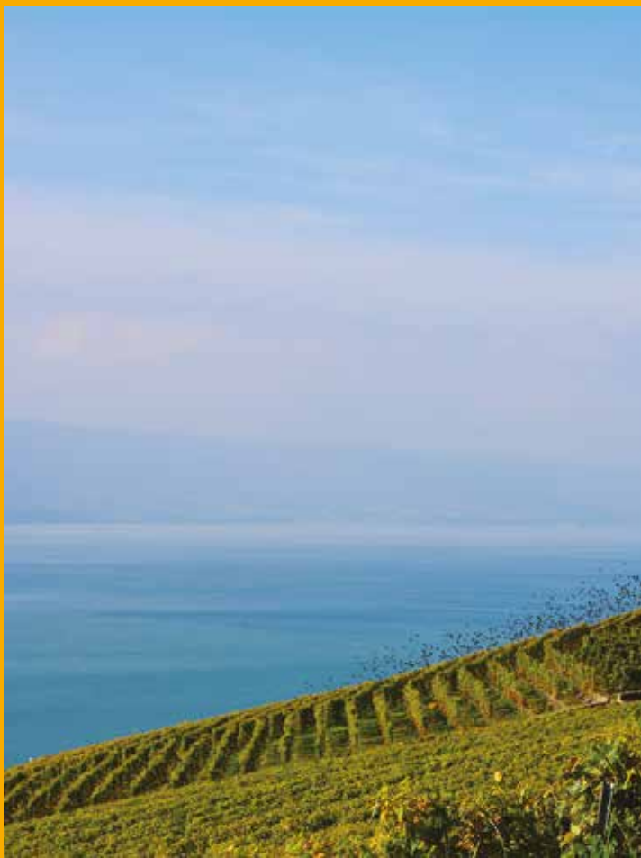
Vol d'étourneaux à travers Lavaux