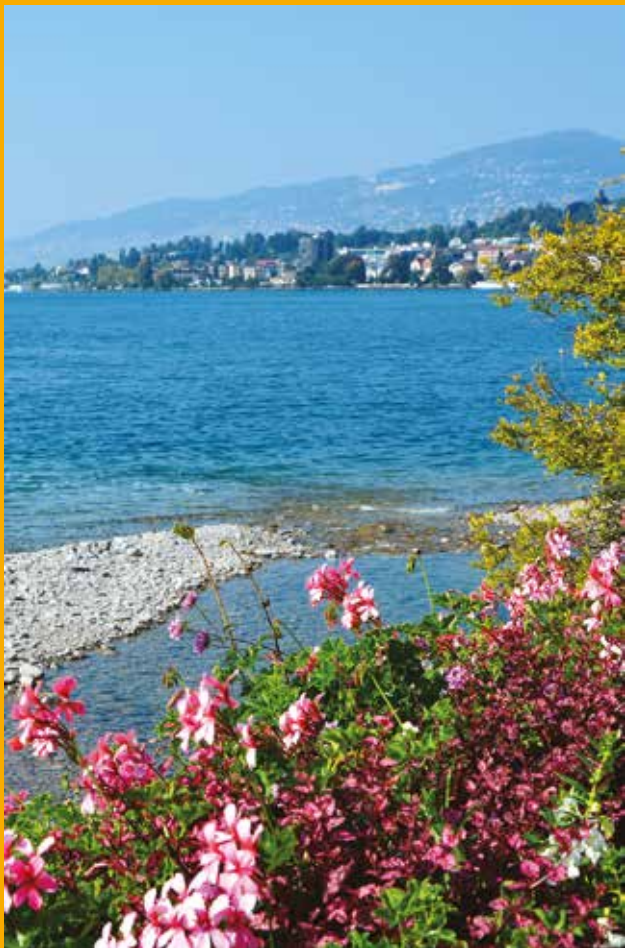
A l'embouchure de la Baye de Montreux