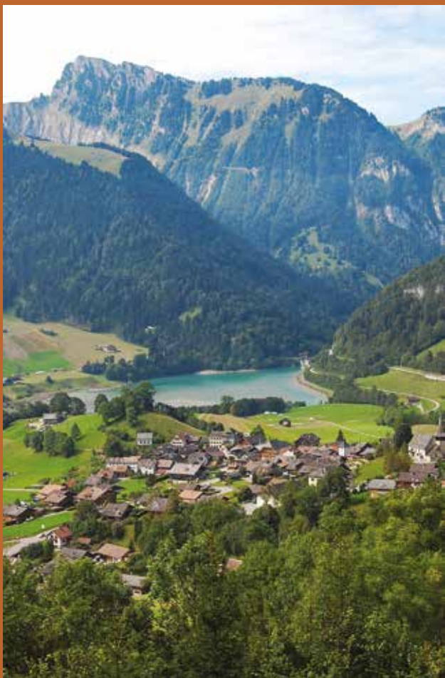
Vue plongeante sur le village de Rossinière