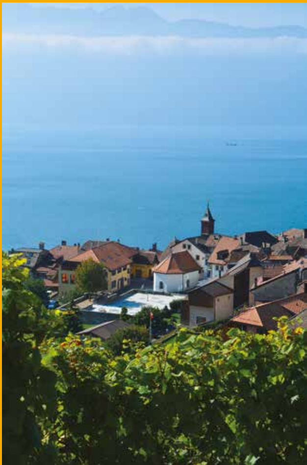
Vue sur le village de Rivaz