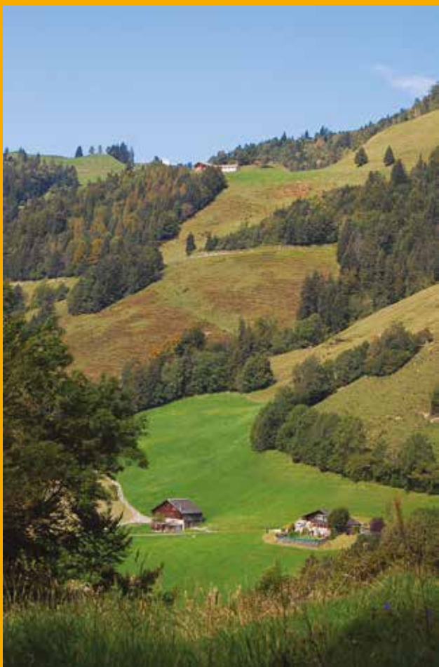
Pâturages du Pays-d'Enhaut