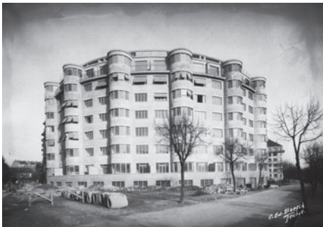
Maison Ronde, M. Braillard. Bibliothèque de Genève

Plus loin, au-delà du rond-point des Charmilles, entre l'avenue d'Aire et la rue de Lyon (et aussi de l'autre côté de celle-ci), c'est un espace industriel qui s'est déployé. Au début du 20 e siècle, Picard-Pictet SA y produisait une voiture : la Pic-Pic. En 1921 y sont fondés les Ateliers des Charmilles qui se spécialisèrent entre autres dans les turbines et les accessoires hydrauliques.