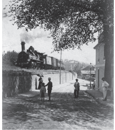
L'ouverture de la rue de Saint-Jean favorisa l'urbanisation du quartier.

A Saint-Jean et aux Charmilles, par blocs, les grandes propriétés furent vendues afin d'être morcelées et couvertes de hauts immeubles dont la Maison ronde de Maurice Braillard (1930), classée monument historique. De nouvelles rues furent ouvertes.