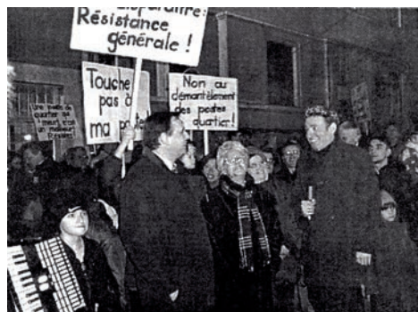
Manifestation pour le maintien de la poste à Saint-Jean, 1999

Le quartier subit l'évolution générale des grandes villes : réhaussements d'immeubles, ventes d'appartements, difficultés de survie pour le petit commerce, ouverture d'un centre commercial à l'Europe. La Poste cherche à liquider son bureau de la rue du Beulet ce qui provoque en 1999 une réaction populaire qui permettra le maintien partiel du bureau postal et contribuera à faire de Saint-Jean un quartier où la démocratie participative est active.