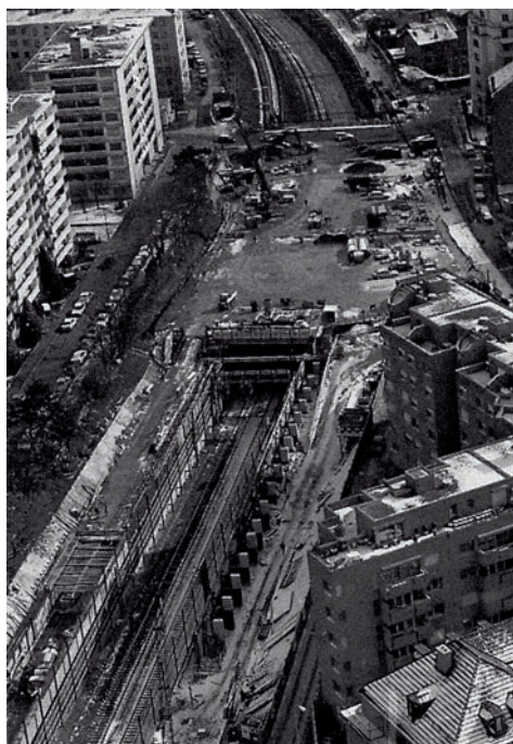
1993 : La couverture en construction entre le Pont Miléant et la rue du Beulet