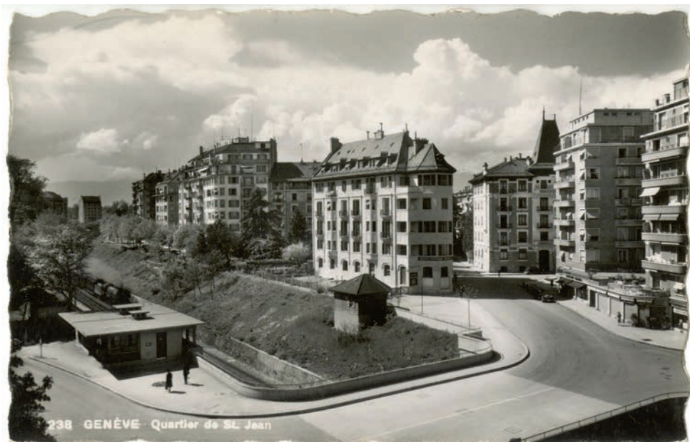
Rue des Charmilles et avenue des Tilleuls vers 1950 (Bibliothèque de Genève)

Avenue des Tilleuls : Elle rappelle l'allée de tilleuls qui se trouvait à cet endroit-là.