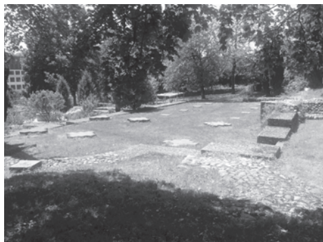
Prieuré de Saint-Jean, état actuel

Désormais, les grottes furent célèbres et une église et un couvent furent bâtis juste à côté. Bien des années plus tard, un croisé revenant de Palestine avec la chaîne de la captivité et un fragment d'os de saint Jean en fit don à l'église qui fut depuis lors dédiée à saint Jean et donna son nom à toute la région.