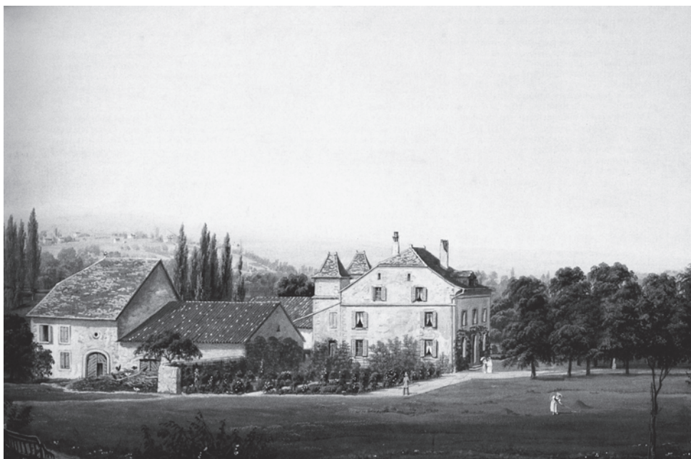
La maison de maître Gallatin/Lalubin, sur l'emplacement actuel de l'école du Devin du Village Aquarelle de Jean Du Bois, 1882, Musée du Vieux Genève. Extrait de « 75 ans d'école à Saint-Jean »

Les terrains se couvrent de vergers et de vignes en hutins, les chemins se bordent d'arbres et l'un d'entre eux devient le chemin des Charmilles, donnant son nom à la partie du quartier en retrait des falaises. Actuellement seules trois de ces maisons de maître subsistent : les Délices, Cayla et Vieuusseux-Masset