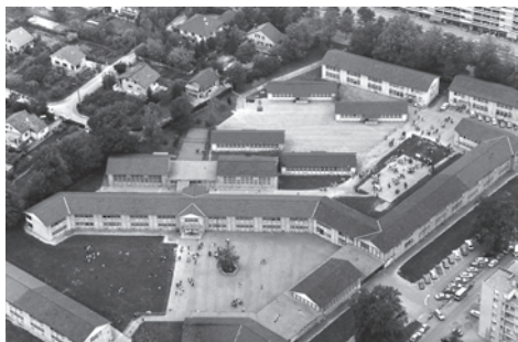
Les pavillons du cycle d'orientation bâtis sur une partie de la campagne Cayla

Dès 1950, on construit intensivement sur les terrains restés libres. Les immeubles des années 50 et 60 remplissent les interstices, qui restaient nombreux. Les grandes propriétés restées quasiment intactes jusqu'alors rétrécissent et sont morcelées : la maison Gerebrow fait place aux immeubles de la rue Miléant, sur une partie de la campagne Cayla, on construit une école primaire et une école secondaire inférieure pour les jeunes filles, reprise ensuite par le Cycle d'Orientation.