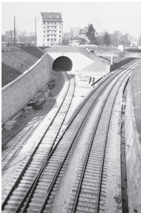
Vers 1943 : La tranchée du train entre Saint-Jean et les Charmilles, vue du Pont de Miléant. Immeuble de l'av. Gallatin.

Dès 1981, face à l'augmentation du bruit des trains occasionnée par l'ouverture de la double voie vers l'aéroport, on étudie la possibilité de couvrir la tranchée entre le Pont des Délices et le Pont du chemin des Sports. Finalement, le Conseil Municipal vote en 1988 les crédits pour une couverture jusqu'au pont de l'avenue d'Aïre. Les travaux durent de 1990 à 1993. La couverture, légèrement surélevée, n'efface pas complètement la coupure entre Saint-Jean et les Charmilles. L'option retenue pour les équipements refuse la création