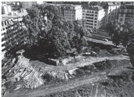
Le tracé de la défunte rue de l'Emile (au premier plan) juste avant la construction de l'école du Devin-du-Village