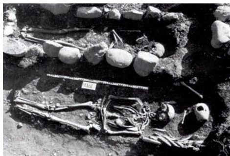
Sépultures trouvées dans l'église

La tradition raconte que vers 500, deux pèlerins, saint Romain et Palade, firent étape près de Genève. Cherchant un lieu pour passer la nuit, ils quittèrent la route de Lyon et descendirent un petit chemin qui menait au bord du Rhône. Là (au bas du sentier Sous-Terre actuel), dans des grottes qui s'ouvraient dans la falaise, ils rencontrèrent deux lépreux obligés de vivre hors de la ville. Saint Romain salua les lépreux en les serrant dans ses bras et en les embrassant. Le lendemain, une fois les deux religieux partis, les deux lépreux s'aperçurent qu'ils étaient libérés des stigmates de la lèpre ! Un miracle !