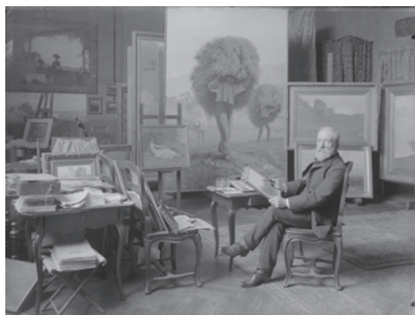
François Furet dans son atelier en 1906

Chemin François-Furet : Peintre genevois, paysagiste et animalier (1842–1919). Au début du morcellement des grandes propriétés, Furet avait son atelier dans une grande villa située à l'angle des rues actuelles Miléant et des Tilleuls.