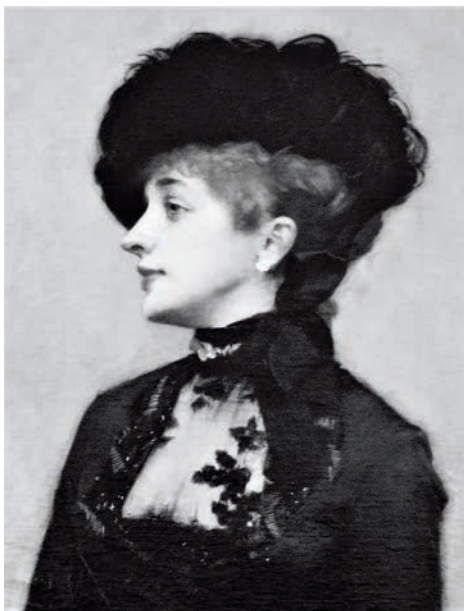
La Parisienne de Charles Giron (détail)