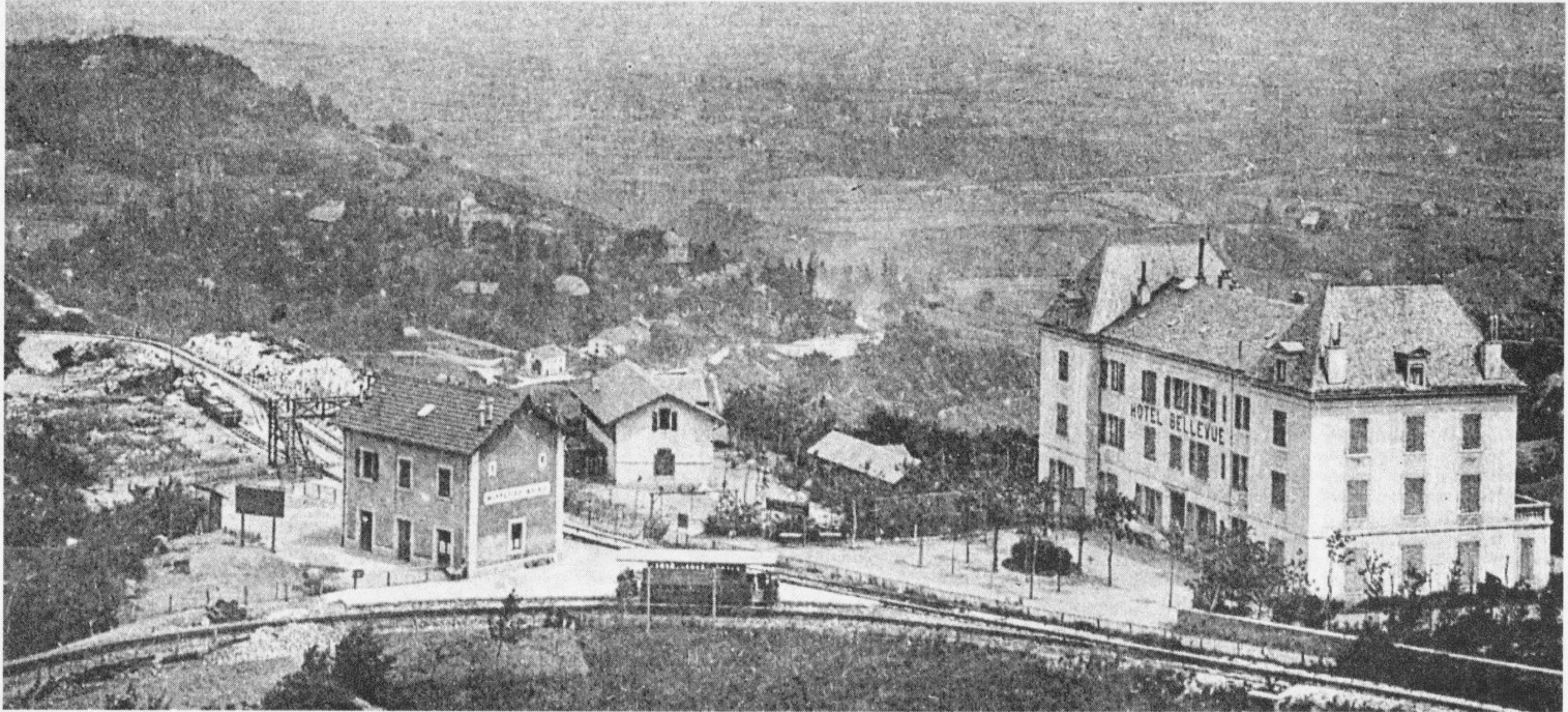
Le chemin de fer du Salève en quelques vues : ci-dessous, l'automotrice à la sortie de l'unique tunnel du réseau, avec en arrière-plan le château de l'Ermitage, à Monnetier.