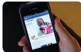
> Positionnement e-tourisme / Page Facebook sur smartphone