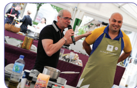
> La filière gastronomique/ Chef d'un jour 2012