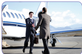
> La filière business / Aérodrome d'Annemasse