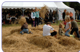
> La filière loisirs et divertissements / Couleur(s) d'Automne