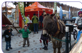
> La filière sport & nature/ Destination Montagne 2012