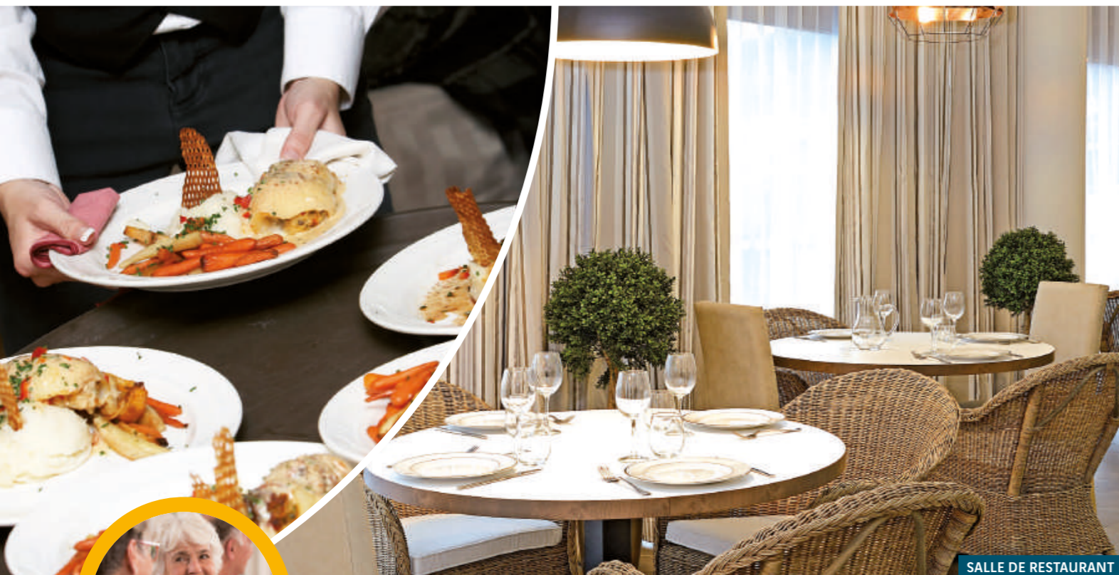
SALLE DE RESTAURANT