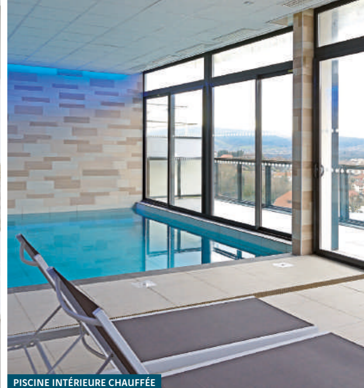
PISCINE INTÉRIEURE CHAUFFÉE