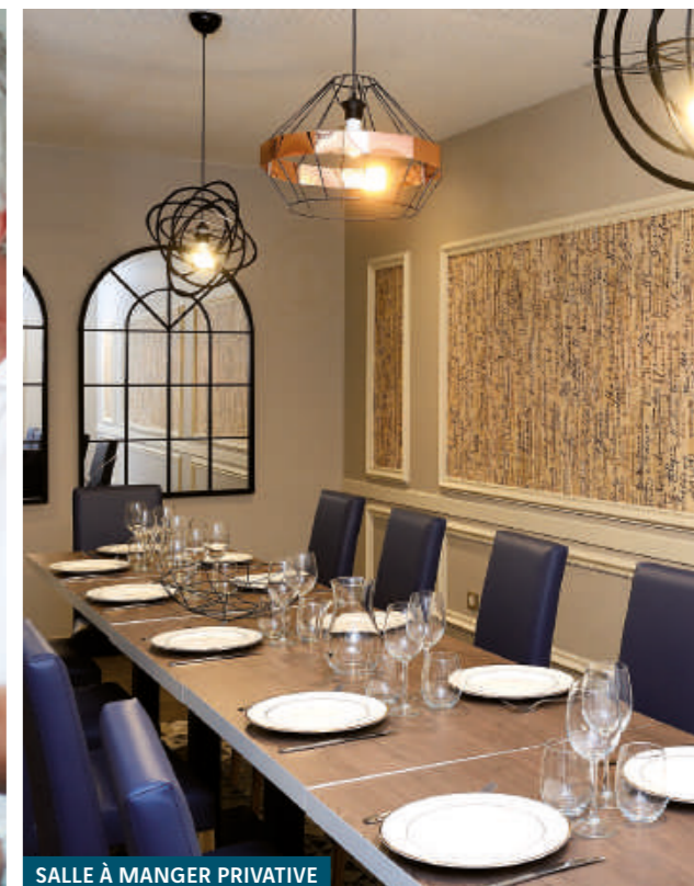
SALLE À MANGER PRIVATIVE