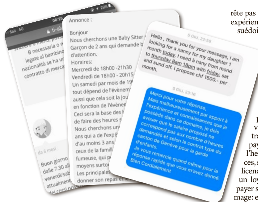
Des annonces sur Facebook qui proposent des salaires ridicules pour garder les enfants.

«Dès que je mentionne mon expérience et que je demande à être payée le salaire minimum, plus personne ne répond. Quelques mois plus tard je vois les mêmes annonces abusives réapparaître», explique-t-elle. Elle raconte que plusieurs de ses échanges ont même tourné au vinaigre: «Lorsque je réponds que c'est illégal, certaines mères de famille me disent que je n'ai qu'à ne pas répondre si je ne suis pas intéressée mais qu'elles ne peuvent pas proposer plus. Elles savent que quelqu'un finira toujours par accepter.»