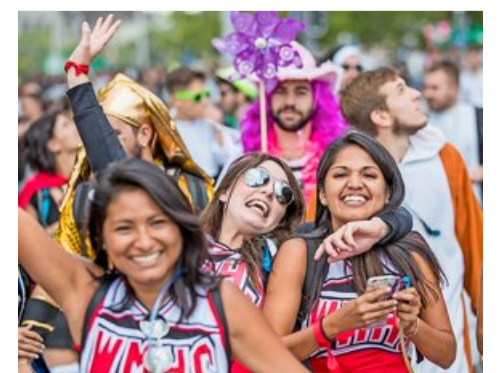
Déguisées ou non, pas loin d'un million de personnes, de tout âge, ont paradé dans les rues de Zurich en suivant l'une des 25 love mobiles.